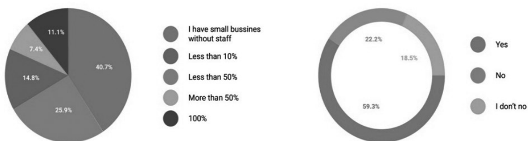
Рис. 3. Частка спільної конфесійної ознаки бізнес-середовище протестантів (зліва: частка працівників-протестантів, справа: частка партнерів-протестантів)

підприємств та організацій, фінансові директори або головні бухгалтери (на невеликих підприємствах головні бухгалтери виконують функції фінансового директора) та працівники-протестанти, що працюють на підприємствах, заснованих відповідно також протестантами. Було опитано 70 респондентів, до яких було адресне звернення щодо участі в нашому дослідженні (тобто, відбувся ретельний підбір респондентів).